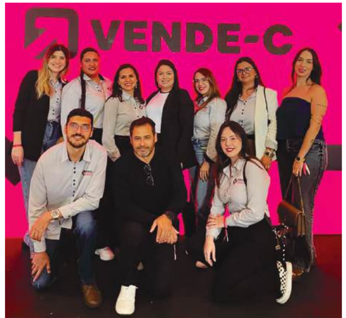
Acima e ao lado, dois momentos registrados pela equipe comercial da Ciasul nos espaços instagramáveis criados para a divulgação do evento. O urso mascote na entrada da convenção foi um elemento que chamou a atenção dos participantes. Abaixo, uma visão geral do auditório da Vibra São Paulo durante a apresentação de uma das conferências do evento.